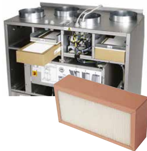
Aggregatets filter sitter lättillgängliga och byts enkelt ut.

Luftbehandlingsaggregatet har två filter som filtrerar bort föroreningar utifrån och som skyddar rotorn från smuts. Filter måste bytas en till två gånger om året. Detta görs enkelt genom att öppna fronten och byta ut de gamla filtren mot nya.