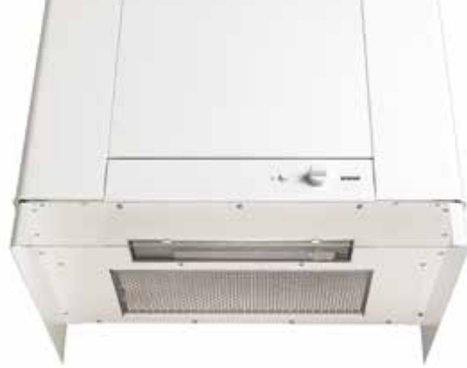
Reglaget för köksventilationen och belysningen är lättillgängligt placerade i fronten.

är spjället helt öppet. När vredet är i läge 3, ökar aggregatet luftmängden till hastighet 3 (forcerad ventilation). Man kan vrida tillbaka vredet manuellt (efter matlagning). För att undvika nedsmutsning av rotorn, går matoset by-pass förbi rotorn.