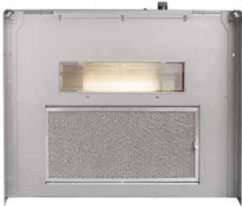
Flexit K2 R sett från undersidan. Fettfiltret och glaset framför kompaktlysrör avlägsnas enkelt.

Vid matlagning öppnas spjället genom att man vrider vredet. När vredet befinner sig i läge 1, är spjället halvöppet. När vredet befinner sig i läge 2,